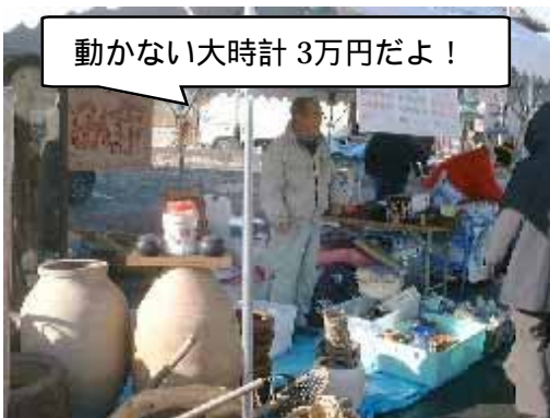
動かない大時計 3万円だよ!