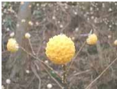
山麓を埋める花の群落です。

ミツマタ祭りがあります。 見学ツアー、紙すき体験、和紙作品指導、和紙作品展示、句会、もちつき大会など 問合先 坂本地区棚田保存会 (85 1375 星合)