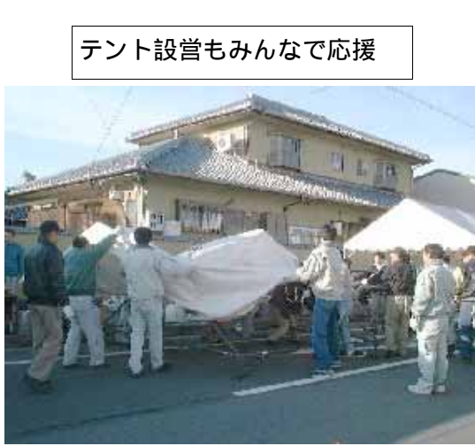
テント設営もみんなで応援