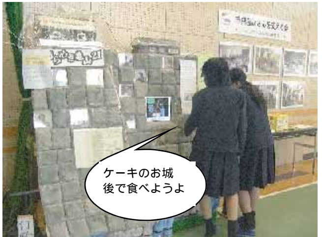
ケーキのお城 後で食べようよ