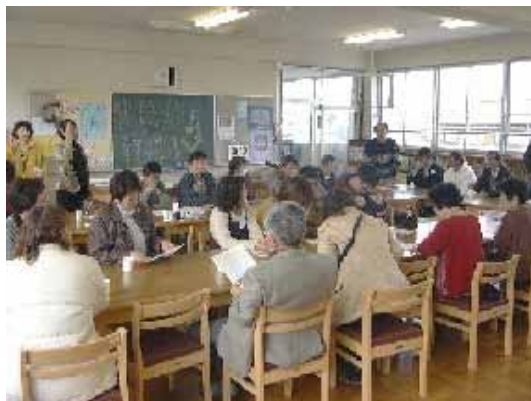
満員の「子どもたち」テーマ会場