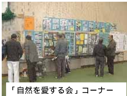
「自然を愛する会」コーナー