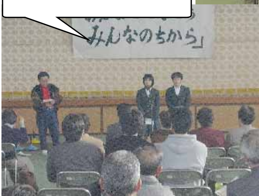
さあオープニング