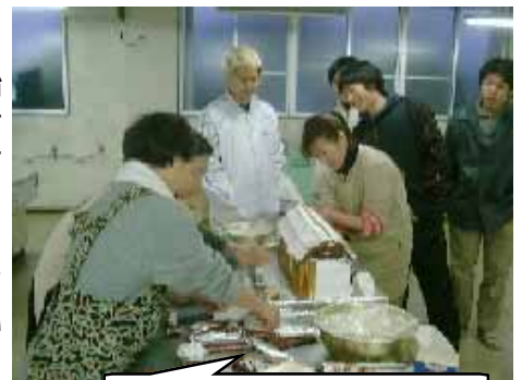
楽しそうなケーキ作り