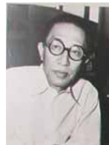
衣笠貞之助 (1896 - 1982)