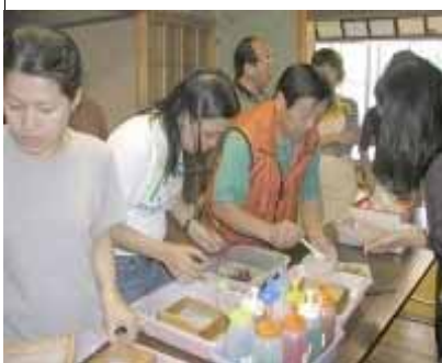
和紙の葉書 手づくり中