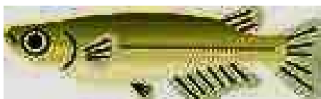
おさかなが いっぱい いるなー

魚類 メダカ、オイカワ・カワムツ、モツゴ、フナ、モロコ、エビ類(カワエビ・ヌマエビ・テナガエビ)、ヨシノボリ類(カワヨシノボリ) ドジョウ、シマドジョウアブラハヤ 等 水生昆虫 ヤゴ類、タイコウチ イモリにウナギ等々でした。