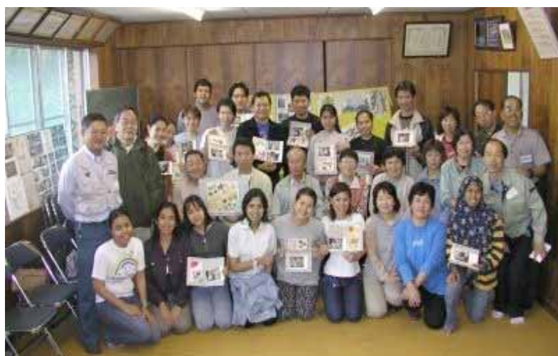
出来上がった作品を持ってKIFAのメンバーと記念撮影 楽しいひとときが過ごせました。