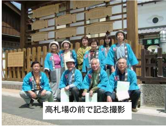
高札場の前で記念撮影