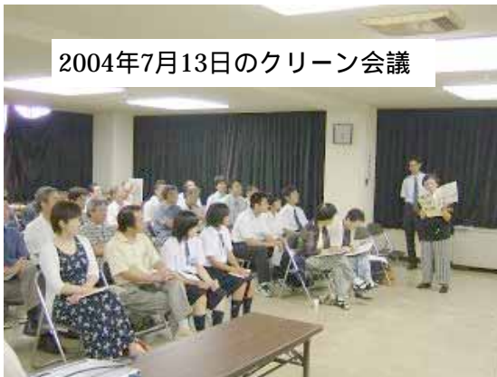
2004年7月13日のクリーン会議

参加者の意見では学校から・こんなに生徒に反響があるとは思わなかった。これからも続いてほしい。関町からは太岡寺がきれいになれば関もきれいになる。この町にはクリーンにする意識があると思った。参加企業から・呼びかけに応じて社員がたくさん出ました。素晴らしい効果を挙げてよかった。その他・毎回クリーン作戦をやってきましたが効果が少なかった。今回は大岡寺のイメージが変わった。今から通る人には明るく変わったと思っていただける。いろんな団体を含めてこれからも続けたらよくなっていく。・壁画がまだ半分くらいなので全体に広げたい。スギナ対策になにかいい方法知恵を出していきたい。コスモス等の種まきもしたい。・11月にクリーン作戦をしたい。これからの環境問題のリーダーの人材育成にもなる。等々の意見が出されました。今、亀山の太岡寺交差点が美しく変わったことが環境サイトマッホー亀山等、全国ネットでも発信されています。