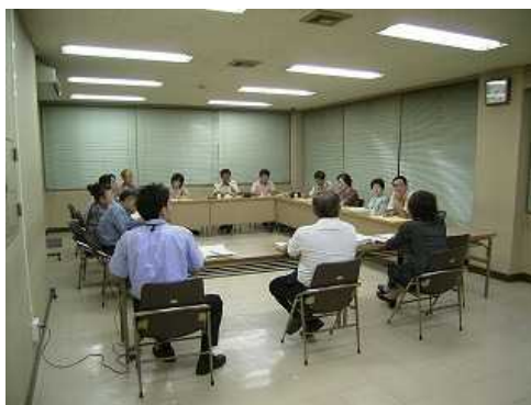
(仮称)市民協働センター運営検討委員会

2006年1月21日(土) 19:30~21:30 「市民交流の日」 「新年の抱負を語ろう」 -----