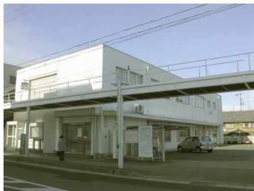
生まれ変わる東町の元百五銀行

鈴鹿市民会館 2006年2月25日(土) 開場17:00 / 開演18:00 26日(日) 開場11:00 / 開演12:00 開場16:30 / 開演17:30 3月には名古屋公演もあり