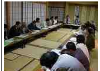
実行委員会(鈴鹿馬子唄会館)