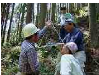
鈴鹿式樹高計で高さ測定

今どれくらいの森林が、手入れされて森林の機能を果たしているのでしょうか?そこで市民が、自然観察指導員の案内で山に入り科学的に、しかも簡単な方法で楽しみながら木の混み具合や植生調査を行うのが「森林の健康診断」です。初めて山に入った皆さんは荒れた森と整備された森林の対比に驚き、ほぼ全員が次回も参加したいと答えていました。今回の調査結果は、大学等の研究者グループにより分析され、この秋に公開されて、これからの森林のための提言につながっていきます。この調査や活動は、今後10年は継続される予定です。今回の調査にあたっては、行政(三重県、亀山市)の後援や地元の区長、森林組合の承諾をいただいています。