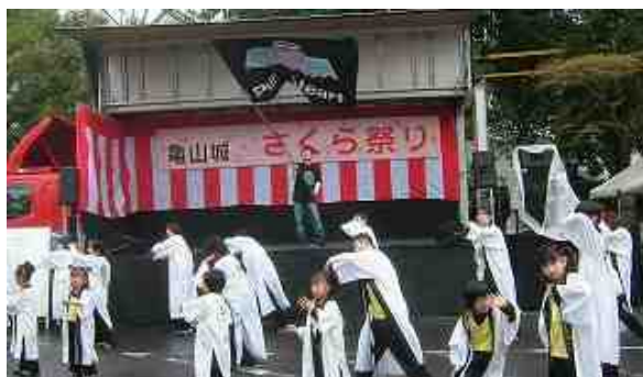
亀山城さくら祭りでのピュアハートの皆さん