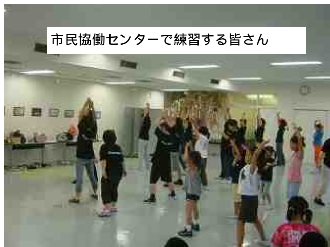
市民協働センターで練習する皆さん

毎年、鈴鹿で開催される“すずかフェスティバル”に向け、練習を重ねています。今年は、「人情集団あんぱんたん」で一緒に仲間が、作詞作曲してくれた素敵な曲“紡ぎ”に載せて踊ります。（浜野）