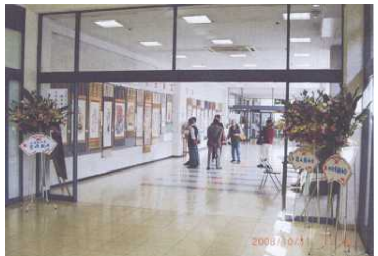
会員個展(エコーにて)