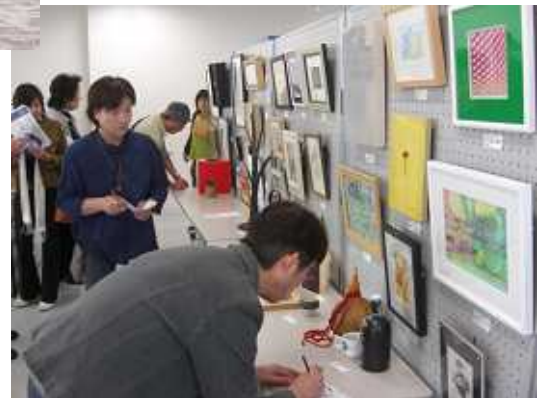
作品プレゼント(みらい)

問合せ アートフォーラム三重 (森/TEL82-4125) 東町商店街 (伊藤/TEL82-0410)