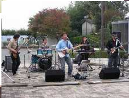
路上ライブ(ふれあい広場)