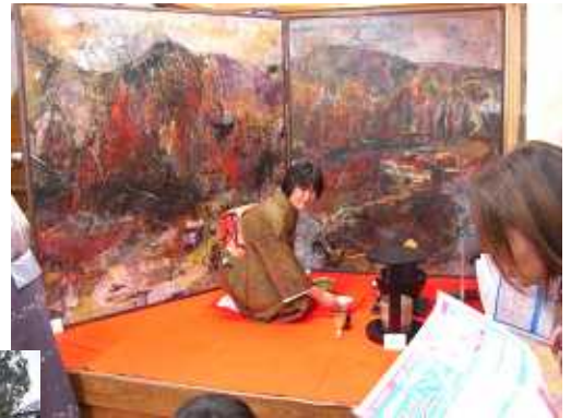
お茶のふるまい(しほりや)

このイベントは、空き店舗が増えている商店街へ「アート」を持ち込むことで、人と人が出会い、人と街に新しいつながりが生まれることを願って企画されました。