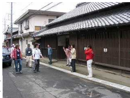
旅の人、ようこそ かめやまへ