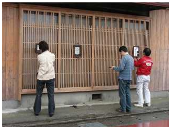
取り付け作業中の皆さん 亀山宿 野村地内