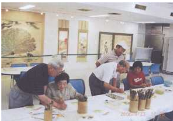
会員展と体験コーナー