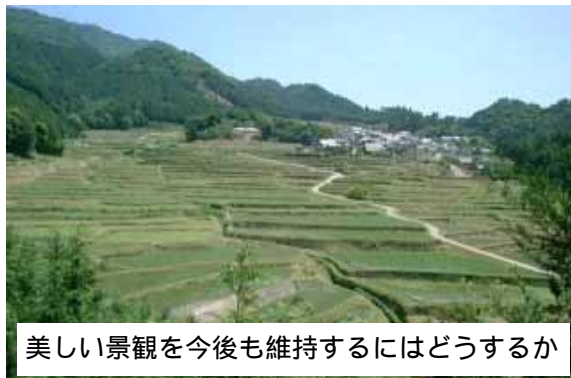
美しい景観を今後も維持するにはどうするか