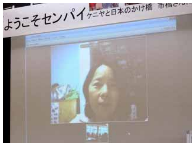
光ファイバーの海底ケーブルで映ったケニヤの画像

子ども達は熱心にノートを取って話を聞いていました。ケニヤの学校の建物は?困っていることは?お金はどこから出るの?など質問もたくさん出ました。