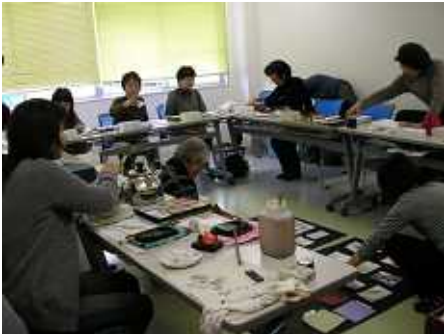
制作活動風景(みらいにて)

「感動、感激、感謝」をモットーに、明るい雰囲気の中、先生やサークルの皆さんのお人柄に助けられて8年、楽しくやってくることができました。