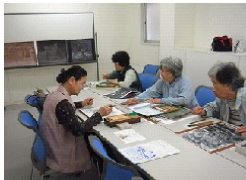
活動の様子 市民協働センター「みらい」にて