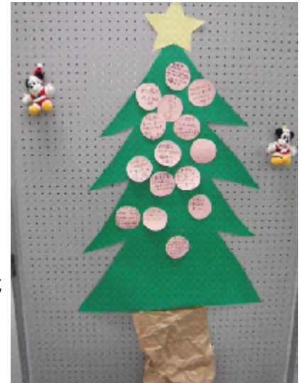
参加者の想いからできたツリー