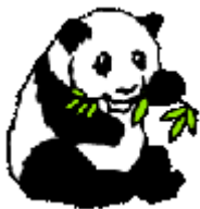
ションマオ 熊猫くん

楽しみながら、中国人に通じる中国語を学べる場として、地道に活動を続けていきたいです。本格的に学びたい方から、日常会話、自己紹介、旅のフレーズだけ覚えたい方まで、老若男女問わず、興味のある方はご連絡ください。お待ちしております。