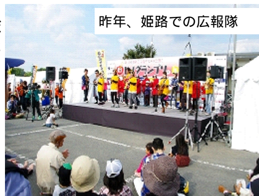
昨年、姫路での広報隊