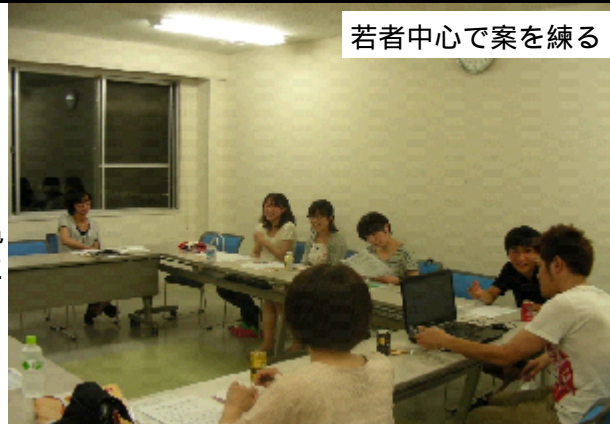
若者中心で案を練る

このイベントに、亀山市からまちおこし市民グループ「亀山みそ焼きうどん本舗」が約40名で参加予定です。いかに亀山みそ焼きうどんを通して亀山市を知ってもらおうか、連日作戦を練っています。