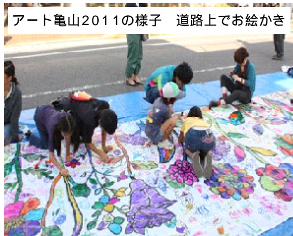
アート亀山2011の様子 道路上でお絵かき

10月28日(日)から約1週間、東町商店街を中心に開催される「アート亀山2012」。東町商店街は昨今、商店街の空洞化が進み、空き店舗も増えています。そこで、「アート」を「まち」に持ち込むことで、人と人が出会い、商店街の別の魅力を引き出そうと、開催されているのがこのアートイベントです。2008年以来、毎年秋に開催されており、今年で5回目の開催になります。今年も、若きアーティストたちが全国から亀山市に集います。